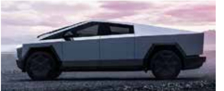
テスラ・サイバートラック